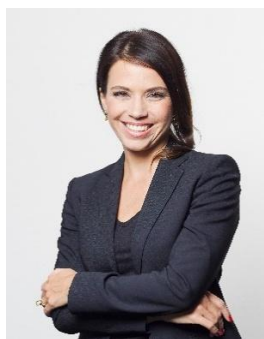
Nina Bendler Nina Bendler Architektur