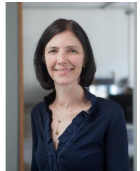
Barbara Schäffer molestina architekten + stadtplaner gmbh