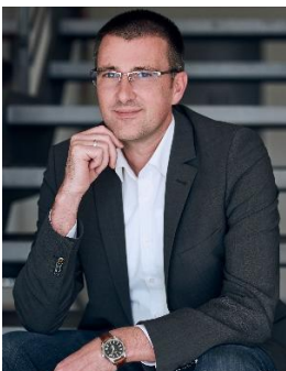
René Schmidt Fritz Meyer GmbH