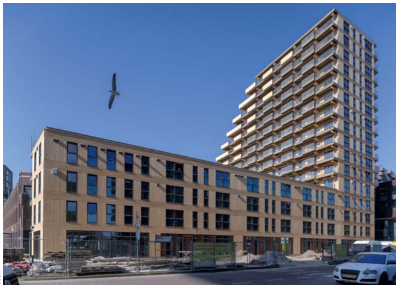
Der Einsatz von Holz als Hauptbaumaterial ermöglicht nicht nur erhebliche CO 2 -Einsparungen im Vergleich zu konventionellen Bauweisen, sondern trägt aktiv zur Reduktion des ökologischen Fußabdrucks bei

Maß an Nutzungsflexibilität bietet. Der Einsatz von Holz als Hauptbaumaterial ermöglicht nicht nur erhebliche CO 2 -Einsparungen im Vergleich zu konventionellen Bauweisen, sondern trägt aktiv zur Reduktion des ökologischen Fußabdrucks bei. Darüber hinaus erfüllt SAWA wichtige Kriterien der Kreislaufwirtschaft: Alle Bauteile sind sortenrein trennbar,