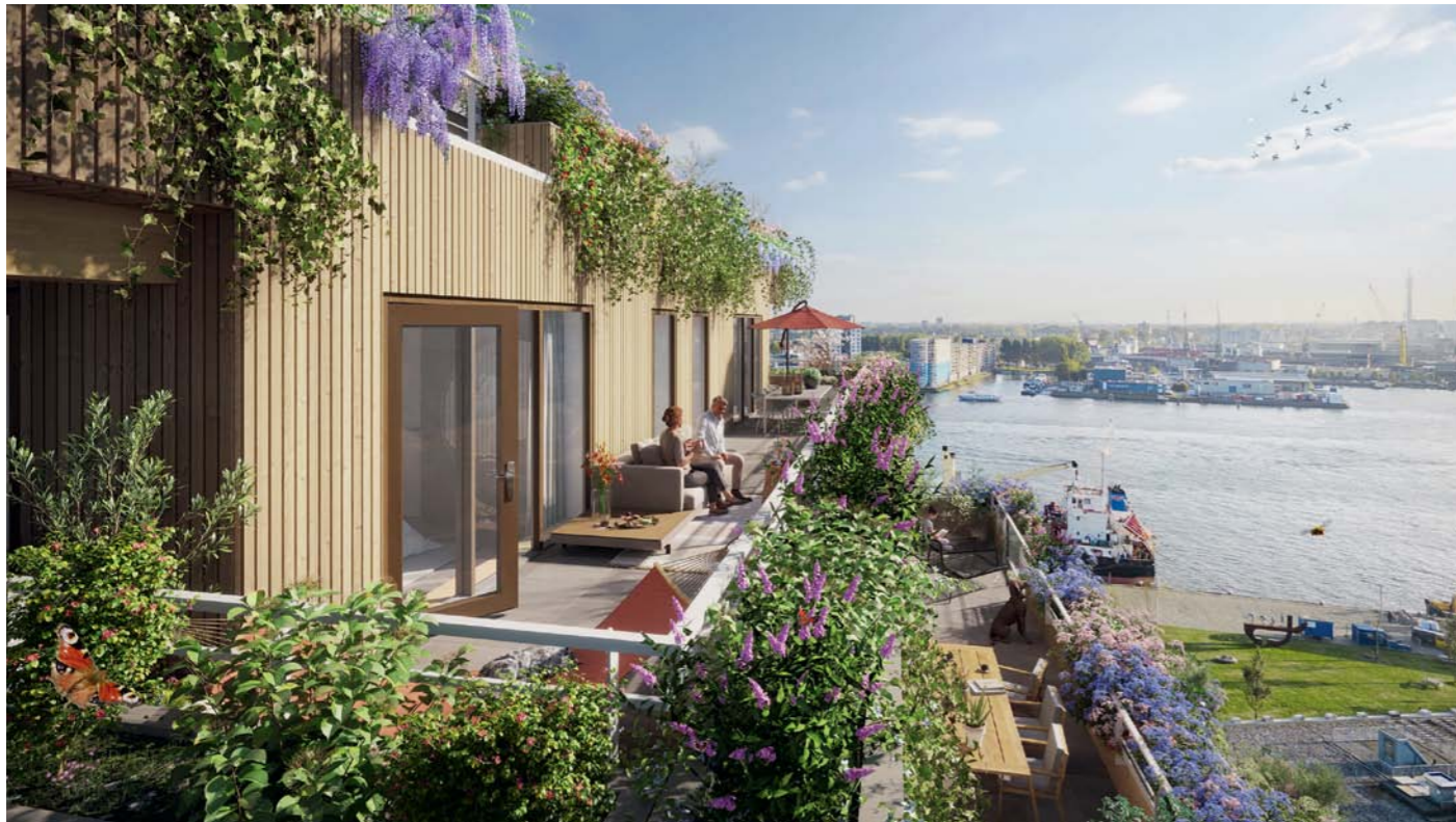
Die begrünten Terrassen und Balkone sind integraler Bestandteil des ökologischen Konzepts